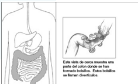
Esta vista de cerca muestra una parte del colon donde se han formado bolsillos. Estos bolsillos se llaman divertículos.